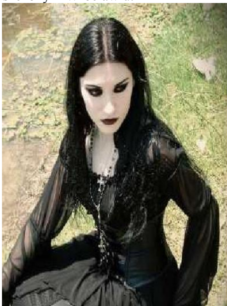
Gothi to subkultura w szczególności związana z Dolnym Śląskiem. Zjeżdżają oni co roku do Bolkowa, intrygując rdzennych mieszkańców miasteczka i jego okolic.

Grupa NIEZNANI ŚWIADKOWIE HISTORII w prezentacji multimedialnej wykorzystała czarno- białe zdjęcia zniszczonych podczas wojny budynków, ulic czy tramwajów, do których dobrała odpowiednie sentencje. Prezentacja nie korespondowała z odczytanym wywiadem ze świadkami wydarzeń historycznych. Rozmówcy grupy opowiadali o rodzinnej miejscowości, o swoich zajęciach, o uwikłaniu w historię czy o zniszczonym Wrocławiu.