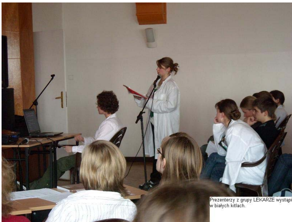
Prezenterzy z grupy LEKARZE wystąpili w białych kitlach.

Grupa DOLNOŚLĄZACY A POWÓDŹ punktem wyjścia swojej prezentacji uczyniła cytata Niektórych wydarzeń się nie wspomina, lecz przeżywa je od nowa . Podczas omawiania tematu odniosła się również do zdjęć z lipca 1997 roku, do fragmentów artykułów oraz ciekawostek i dowcipów o powodzi, a także wywiadów z osobami, które ją przeżyły. Przedstawiła kalendarium wydarzeń z 3-22 lipca 1997 i pokazała, jak powódź wpłynęła na życie wybranych osób. Na zakończenie porównała w tabeli punkty widzenia ludzi dotkniętych bezpośrednio i pośrednio powodzią.